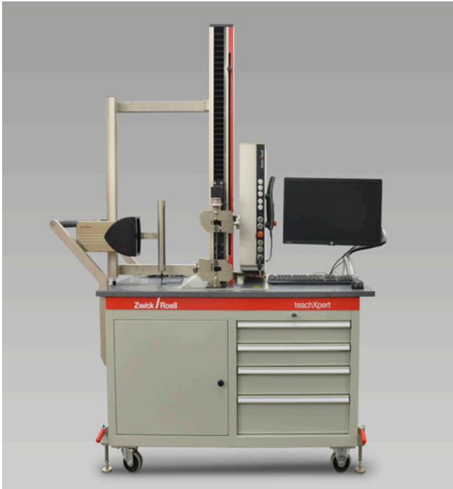
teachXpert (Abbildung ähnlich)